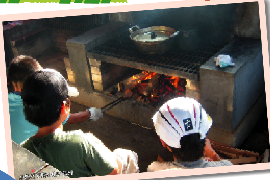
かまどで薪を使い調理