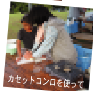
カセットコンロを使って