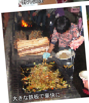
大きな鉄板で豪快に