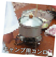
キャンプ用コンロ